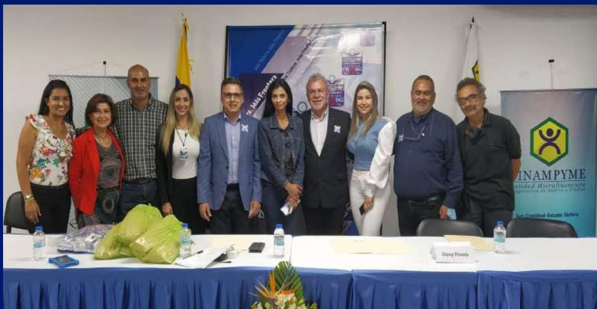
Equipo de Trabajo de Fedecámaras Táchira