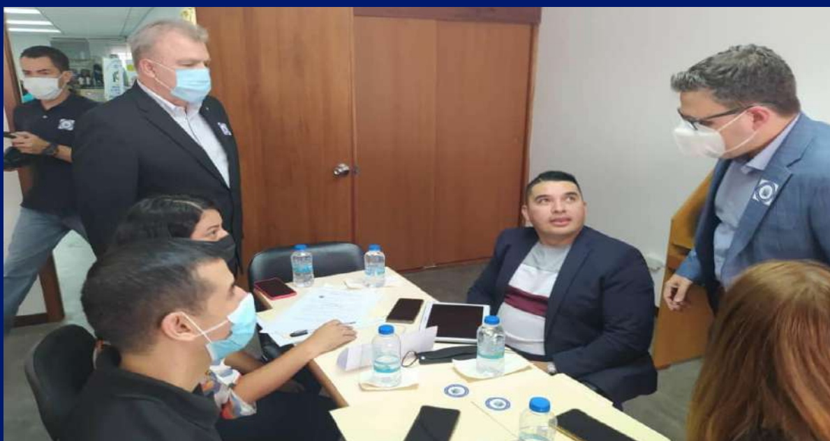
Mesa de Tecnología