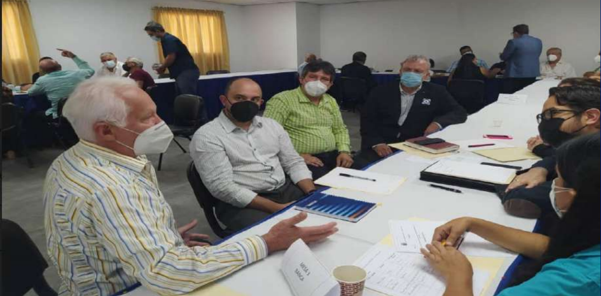
Mesa del sector Banca