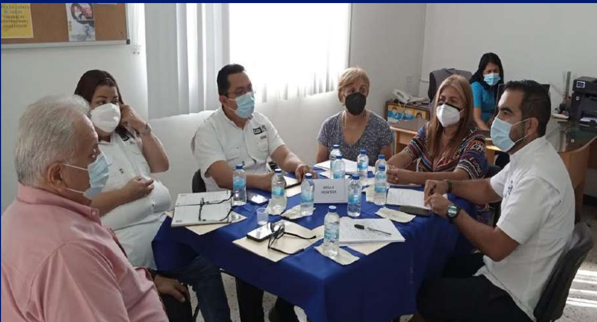
Mesa de Frontera, conformada por empresarios de Ureña, San Antonio del Táchira y aduaneros