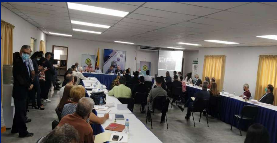
Mesas de Desarrollo Regional en Táchira