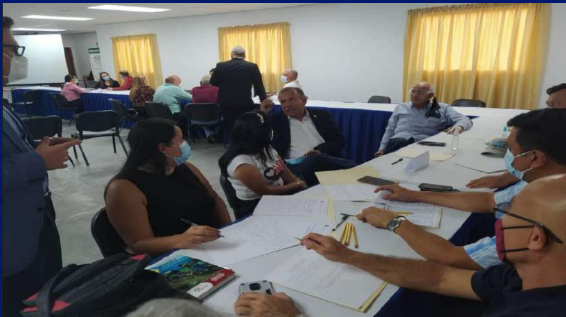
Mesa Agrícola y Pecuaria