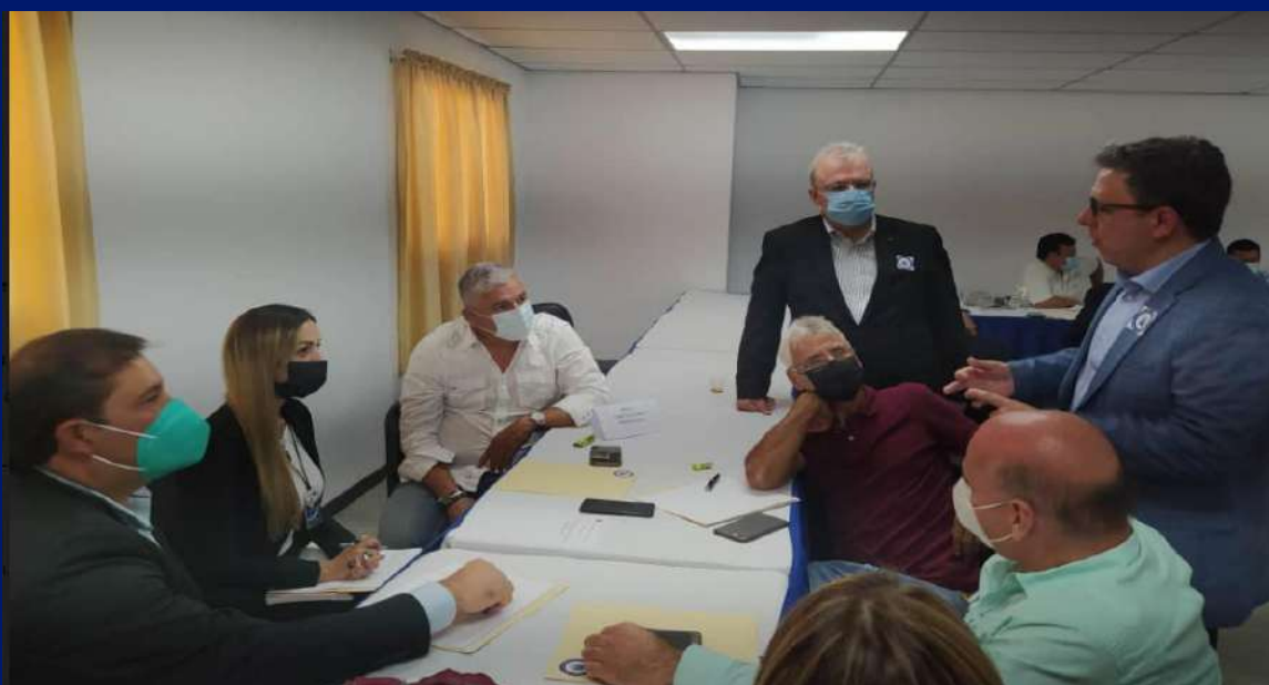
Mesa del Sector Inmobiliario