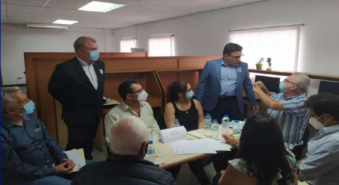
Mesa de Industria