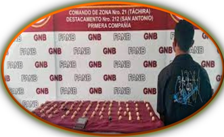
Frontera: En menos de una semana agarraron a 6 narcomulas en Táchira