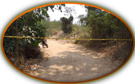
Otro hecho de sangre se registró en los pasos informales que unen a Villa del Rosario con San Antonio del Táchira (Venezuela).

La Secretaría General de la Organización de los Estados Americanos (OEA) emitió un comunicado rechazando la carta enviada por el Estado venezolano al Consejo de Seguridad de Naciones Unidas, donde expone su versión de los hechos sobre las actuales hostilidades que existen en la frontera entre Colombia y Venezuela, específicamente en el estado Apure. A continuación el comunicado: