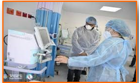
Declaran alerta roja en Norte de Santander por aumento de pacientes en UCI