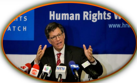
HRW: Denuncia aberrantes abusos contra civiles en frontera con Colombia

La frontera venezolana está cada vez más controlada por grupos armados irregulares de origen colombiano que se apropian de los territorios limítrofes con Colombia y Brasil para desarrollar operaciones de cultivo, procesamiento y tráfico de estupefacientes que, en alianza con grandes carteles transnacionales, han convertido a Venezuela en un gran aeropuerto de ilegalidad, pues a lo largo de 15 entidades federales del país se desarrollan diversas operaciones de narcotráfico. En la labor de monitoreo, documentación y visibilización de las constantes violaciones de derechos humanos efectuada por FundaRedes en los estados Táchira, Zulia, Apure, Falcón, Bolívar, Amazonas, Delta Amacuro, Sucre, Anzoátegui y Nueva Esparta hemos recibido alertas de ciudadanos que han observado la existencia de pistas clandestinas empleadas para el tráfico de drogas y minerales. El proceso de ocupación y apropiación de fincas ha permitido a las disidencias de las FARC y al ELN, hacerse de grandes extensiones de terreno para estos fines.