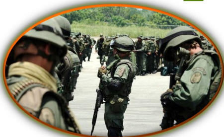
FANB confirma bajas y detenidos en “cruentos combates” en Apure

FundaRedes mantiene un monitoreo constante en seis estados fronterizos de Venezuela (Falcón, Zulia, Táchira, Apure, Bolívar y Amazonas) lo que, en conjunto con el seguimiento a informaciones de carácter nacional, permite a la organización generar análisis sobre los posibles escenarios a desarrollarse en diversos ámbitos. Así, en nuestro informe de contexto de febrero, se advertía ya lo que en marzo se ha consolidado como una de las más importantes situaciones fronterizas de los últimos años, las confrontaciones directas y sostenidas entre las Fuerzas Armadas venezolanas y una facción de las disidencias de las Farc. Comprender a detalle estos hechos obliga a una mirada profunda en ámbitos como el sistema político y democrático que por mandato de la Constitución debe imperar en el país, pero contrariamente ha sido sustituido por un autoritarismo que socava las libertades civiles; la emergencia humanitaria compleja que afecta a todos los sectores de la vida económica y social; la relación de Venezuela con sus vecinos; la violencia que se vive en comunidades urbanas y rurales; los desplazamientos humanos tanto en procesos de migración interna, como la migración forzada allende nuestras fronteras; e incluso, la voraz afectación al medio ambiente.