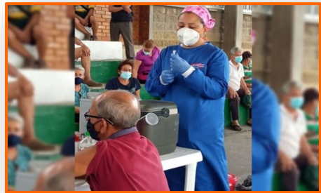
Cruzan las trochas para vacunarse contra la covid-19 en Colombia

La organización estadounidense Humans Rights Watch (HRW) denunció este lunes que las fuerzas de seguridad venezolanas estarían cometiendo aberrantes abusos contra la población civil, entre ellos ejecuciones extrajudiciales, en su embestida contra grupos armados ilegales que operan en el estado de Apure, cerca de la frontera con Colombia. Según HRW, los casos siguen un patrón sistemático que se ha detectado en las actuaciones de ese país en otras instancias y que están siendo investigados por la justicia internacional por posibles crímenes de lesa humanidad. La denuncia hace parte de un informe realizado por HRW y que se basa en entrevistas con más de 68 personas, entre ellos víctimas del desplazamiento, abogados, peritos, autoridades locales y representantes de organizaciones humanitarias al igual que videos y fotos de los incidentes.