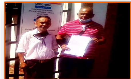
FundaRedes exigió a la Fiscalía investigar amenazas contra periodista en Amazonas

Otro hecho de sangre se registró en los pasos informales que unen a Villa del Rosario con San Antonio del Táchira (Venezuela). Al mediodía de ayer, fue encontrado en la trocha La Carbonera, en las inmediaciones de Boconó, el cadáver de un hombre, que llevaba 26 días desaparecido. “La hipótesis que tenemos es que lo asesinaron en territorio venezolano y luego lo arrojaron en este lado colombiano. Se encontró rastro de sangre que provenía de metros atrás, además la posición y características del cuerpo indican que ese no es el lugar donde lo ultimaron”, indicó la fuente judicial. Durante lo corrido de estos casi cuatro meses de 2021, en ese paso fronterizo, los violentos han asesinado a tres hombres, sin embargo, el número de muertes durante el 2020 en ese sector pasaron la docena de casos.