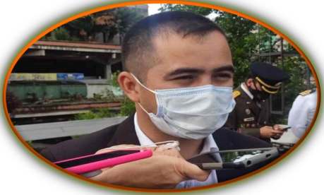
Vigilarán para evitar que funcionarios públicos trasladen particulares a la frontera