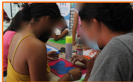
EACANNA, el centro de atención especial para niños y adolescentes migrantes venezolanos y retornados colombianos en La Parada