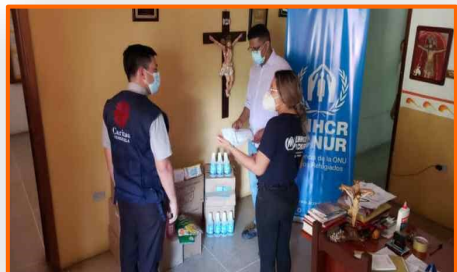
Acnur dona insumos de bioseguridad a Caritas San Cristóbal para caminantes