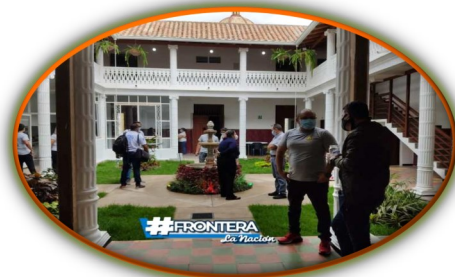
Entra en funcionamiento Casa de Alojamiento Temporal en San Antonio