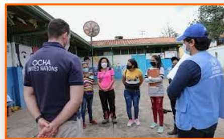
OCHA informa suspensión de algunas actividades humanitarias en Apure debido al conflicto