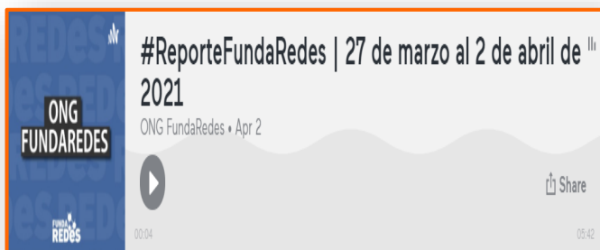
Reporte FundaRedes | 27 de marzo al 2 de abril de 2021