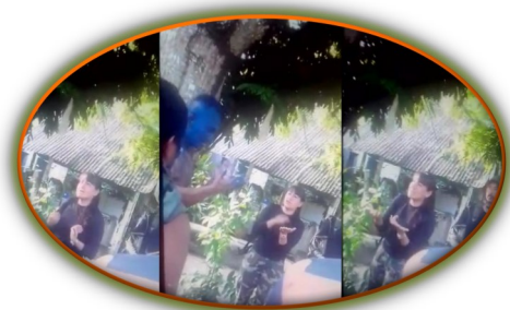
Presuntos guerrilleros piden reconocimiento como "fuerza beligerante" a pobladores de Amazonas (video)