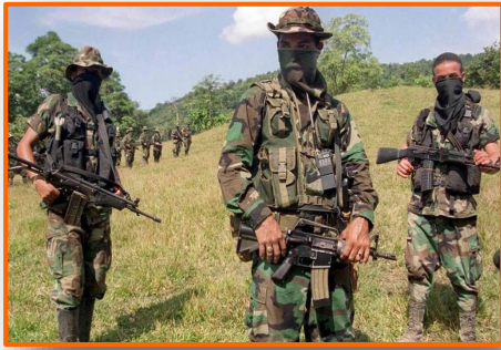
Grupos armados crecen en Venezuela mientras combaten en frontera