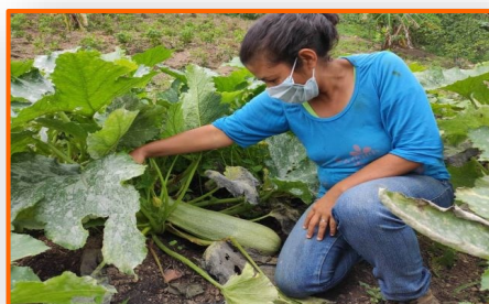
La FAO con cooperación de Bélgica brindarán apoyo a familias vulnerables en estados fronterizos para reducir la inseguridad