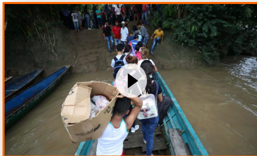
France 24: El drama en la frontera de Venezuela y Colombia tras dos semanas de enfrentamientos

Los combates en el estado fronterizo de Apure ya cumplen quince días y la información todavía es difusa. Mientras las autoridades venezolanas hablan de enfrentamientos con grupos irregulares colombianos, algunos de los cerca de 5.000 desplazados que huyeron hacia Colombia sostienen que las autoridades le dispararon a civiles y los hicieron pasar por guerrilleros. La violencia continúa entre ambos países. La situación se agrava más al tener en cuenta que cuatro de cada diez desplazados son menores de edad, según el Consejo Noruego para Refugiados. Después de dos semanas de combates, la violencia no cesa en territorio venezolano al punto que muchos organismos humanitarios tuvieron que parar sus actividades en la zona, como lo dijo OCHA. Dominika Arseniuk, directora del Consejo Noruego para los Refugiados (NRC) en Colombia, también señaló que la violencia en el estado de Apure continúa. "Las personas con las que hemos hablado están aterrorizadas y temen por sus vidas", precisó Arseniuk en un comunicado de la organización. Y mientras muchos venezolanos continúan con estos temores, la crisis humanitaria sigue sin saber con certeza qué está ocurriendo en los combates.