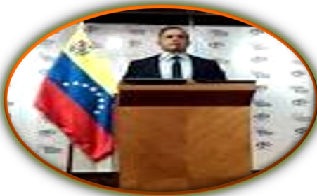
Ministerio Público investigará presunta masacre de familia por parte de la GNB en El Ripial (Apure)

Los gobiernos de Venezuela y Colombia reforzaron la seguridad en la frontera para hacer frente al conflicto armado protagonizado por la guerrilla (disidentes de las Fuerzas Armadas Revolucionarias de Colombia, Farc) y el Ejército Venezolano en la población de La Victoria, municipio Páez del estado Apure, que desde el pasado domingo 21 de marzo ha generado hasta ahora el desplazamiento forzado de 3.280 personas desde Apure hasta Arauquita, Colombia. Debido a esta realidad, las autoridades colombianas decidieron aumentar, en un Consejo de Seguridad en Arauca, el número de efectivos militares, de 700 a más de 2.000 soldados en esta zona limítrofe. Por otra parte, una comisión de las Fuerzas de Acciones Especiales (Faes) de la Policía Nacional Bolivariana (PNB) llegó al estado Apure este miércoles, 24 de marzo, con la finalidad de apoyar el denominado Operativo Escudo Bolivariano 2021, creado con el objetivo de combatir a la guerrilla, según el gobierno de Nicolás Maduro.