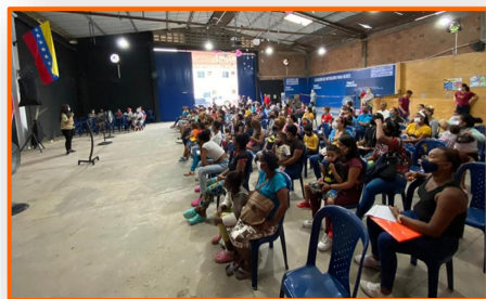
Estoy en la Frontera lidera charlas sobre el Estatuto de Protección para Migrantes