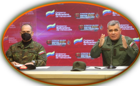
FANB anuncia 6 muertos, 27 sospechosos a la orden de tribunal militar y 12 detenidos en Apure

La Junta Internacional de Fiscalización de Estupefacientes (JIFE) de la ONU reveló que en el estado venezolano de Zulia, fronterizo con Colombia, se detectó la presencia del cártel de Sinaloa, en cooperación con la guerrilla colombiana Ejército de Liberación Nacional. De acuerdo con el informe anual de la JIFE, en esa región venezolana existen pistas de despegue clandestinas, utilizadas para el tráfico de cocaína hacia el Caribe y Centroamérica, y señala que en 2019 las autoridades venezolanas confiscaron 23 avionetas y destruyeron 36 pistas. La JIFE es un órgano independiente y con un perfil judicial constituido por 13 expertos con un mandato de cinco años, que tienen como función verificar el cumplimiento de las Convenciones internacionales sobre drogas.