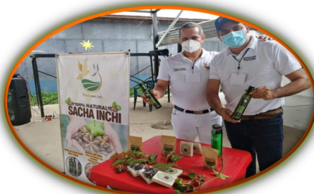
Ocho emprendimientos dirigidos a población migrante, retornados y colombianos: Gobierno departamental de Arauca