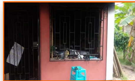
Habitantes de Apure denuncian violaciones de derechos humanos por parte de funcionarios de la FANB