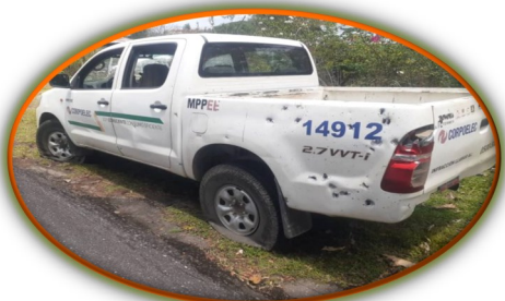
Camioneta de Corpoelec fue atacada a tiros en combate con la guerrilla en Apure