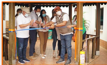
Se inaugura hogar de paso en Villa del Rosario para la niñez refugiada y migrante no acompañada proveniente de Venezuela