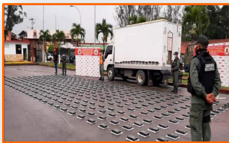
Carteles abren ruta de tráfico de droga por la Región Andina