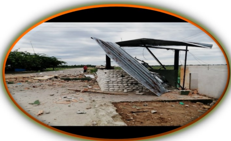
Confirman nuevo ataque a instalación militar de Tres Esquinas en Apure. #29Marzo

Los enfrentamientos entre disidencias de la extinta guerrilla de las FARC y las Fuerzas Armadas de Venezuela provocaron la huida de miles de personas en la frontera entre ambos países durante la última semana. El Gobierno colombiano pidió ayuda a la comunidad internacional para hacer frente a la emergencia humanitaria. Son casi 4.000 personas, la mayoría venezolanas, las que huyen desde hace días de estos enfrentamientos. Los enfrentamientos suceden en el estado venezolano de Apure, limítrofe con el departamento colombiano de Arauca. La mayoría de desplazados se concentran en la localidad colombiana de Araucuita. El director de Migración Colombia, Juan Francisco Espinosa, emitió una declaración donde aseguró que "3.961 personas, de las cuales 2.536 son venezolanas", atraviesan esta emergencia humanitaria. "Este es el resultado de esta incursión terrorista en territorio venezolano", agregó.