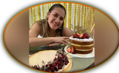
Expoemprende Cúcuta: una herramienta para crecimiento de empresarios migrantes venezolanos y retornados colombianos en la zona fronteriza colombiana