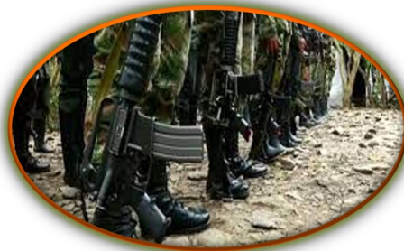
Freddy Bernal: FANB detuvo a 114 paramilitares en Táchira