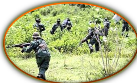
Director del Servicio Jesuita a Refugiados: es urgente una acción coordinada para detener la violencia en la frontera

Tanto la ONG Fundaredes como lugareños del sector Tres Esquinas, parroquia Rafael Urdaneta, municipio Páez del estado Apure, confirmaron este lunes por la mañana que se produjo un ataque a un punto de control militar del sector pasada la una de la madrugada. Algunos pobladores contaron que escucharon unas detonaciones entre el lugar mencionado y la zona de La Charca, ubicada entre esa parroquia y la población de El Nula, parroquia San Camilo. Por fortuna no se reportan muertos ni heridos. También relataron que escucharon el sobrevuelo de aeronaves y el ruido de algunas bombas. En la mañana de este lunes el movimiento de personas era mínimo en comparación con días anteriores. Este domingo 28 se cumplió una semana de los primeros enfrentamientos entre militares venezolanos y grupos de insurgentes en la zona de La Victoria, también de la parroquia Urdaneta, en los que también fue afectada la sede de la aduana subalterna y una camioneta de la estatal Corpoelec.