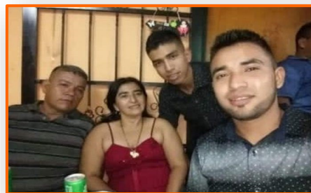
Enfrentamientos en Apure: denuncian falso positivo en asesinato de una familia en El Ripial

Tanto la ONG Fundaredes como lugareños del sector Tres Esquinas, parroquia Rafael Urdaneta, municipio Páez del estado Apure, confirmaron este lunes por la mañana que se produjo un ataque a un punto de control militar del sector pasada la una de la madrugada. Algunos pobladores contaron que escucharon unas detonaciones entre el lugar mencionado y la zona de La Charca, ubicada entre esa parroquia y la población de El Nula, parroquia San Camilo. Por fortuna no se reportan muertos ni heridos. También relataron que escucharon el sobrevuelo de aeronaves y el ruido de algunas bombas. En la mañana de este lunes el movimiento de personas era mínimo en comparación con días anteriores. Este domingo 28 se cumplió una semana de los primeros enfrentamientos entre militares venezolanos y grupos de insurgentes en la zona de La Victoria, también de la parroquia Urdaneta, en los que también fue afectada la sede de la aduana subalterna y una camioneta de la estatal Corpoelec.