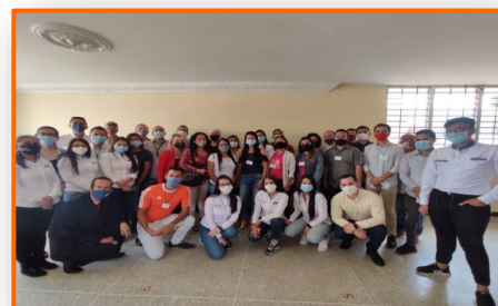
FundaRedes formó a más de 30 nuevos activistas en DDHH en Táchira

En la población de El Nula, parroquia San Camilo, municipio Páez del estado Apure, funcionan dos programas de la cumpleañera Fe y Alegría. La escuela técnica José Pastor Villalonga y el Instituto Radiofónico Fe y Alegría se integran en uno solo para ofrecer educación de calidad, cada quien en su especificidad, en este lado de la frontera venezolana. Por estos equipos educativos y comunicacionales han pasado personas de buena voluntad, gente buena que ha hecho historia.