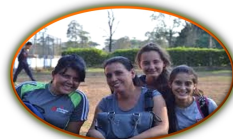
Apure: Fe y Alegría en El Nula “es una institución única que hay que valorar”