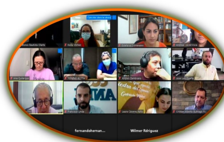
Un objetivo, sensibilizar en temas migratorios: Ciclo de talleres de sensibilización y empatía dirigidos a funcionarios públicos en Norte de Santander, Arauca y La Guajira.

En la población de El Nula, parroquia San Camilo, municipio Páez del estado Apure, funcionan dos programas de la cumpleañera Fe y Alegría. La escuela técnica José Pastor Villalonga y el Instituto Radiofónico Fe y Alegría se integran en uno solo para ofrecer educación de calidad, cada quien en su especificidad, en este lado de la frontera venezolana. Por estos equipos educativos y comunicacionales han pasado personas de buena voluntad, gente buena que ha hecho historia.