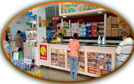
El negocio de vender productos colombianos en Venezuela

Hace muchos años ya, el territorio del estado Apure se lo dividieron los grupos irregulares, llámense FARC, ELN o FBL/FPLN; antes operaban de forma clandestina, ahora son públicas, visibles en todo el estado.