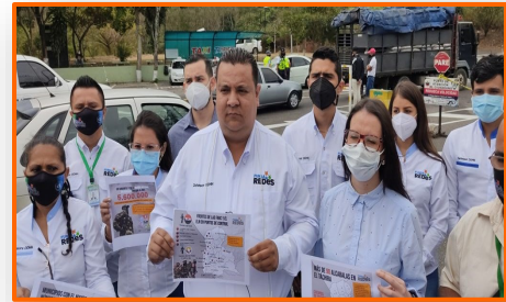
FundaRedes: "Más de 90 alcabalas ilegales en el Táchira usan la pandemia como excusa para la extorsión"