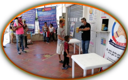
Fundación Nueva Ilusión cumple dos años al servicio del migrante en Norte de Santander.