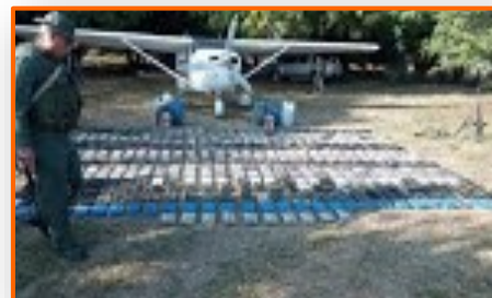
Organismos de seguridad en Apure incautan 537 kilos de droga

Durante un operativo de patrullaje de reconocimiento y escudriñamiento, los funcionarios militares, adscritos al Destacamento 354 de Frontera de la guardia nacional (GN) y a la 912 Brigada Coronel Julián Mellado incautaron este domingo 22 de febrero de este año, en el sector Los Caobos, municipio Pedro Camejo en el estado Apure, un total de 537 kilogramos de presunta cocaína, así como también 320 litros de combustible para aeronaves JET-A1. Se conoció que durante este procedimiento coordinado por la Zona Operativa Integral (Zodi-Apure) y la GN, los funcionarios militares, también detectaron y destruyeron una pista clandestina de aproximadamente 2.100 metros de longitud x 12 metros de ancho, empleada para el tráfico ilícito de drogas provenientes de Colombia.