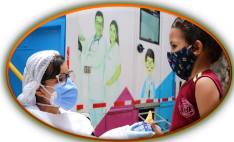
Loable: casi 700 mil venezolanos fueron vacunados en el Norte de Santander