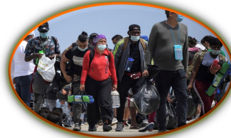
Colombia extiende el cierre de fronteras hasta el 1 de junio

Al menos dos soldados murieron y 11 más resultaron heridos en un ataque con explosivos de presuntos guerrilleros del Ejército de Liberación Nacional (ELN) en las afueras de Cúcuta, en la frontera con Venezuela, informó el ejército este miércoles. El comandante del ejército, el general Eduardo Zapateiro, describió en un tuit el atentado como un “acto terrorista que infringe flagrantemente el derecho internacional humanitario”. El ELN no se ha pronunciado sobre el ataque. El alto mando militar en Colombia asegura que esa organización emplea como retaguardia el territorio venezolano con la complicidad de autoridades chavistas. Según las autoridades, unos 900 guerrilleros del ELN se ocultan del otro lado de la frontera. El gobierno venezolano de Nicolás Maduro niega esas denuncias.