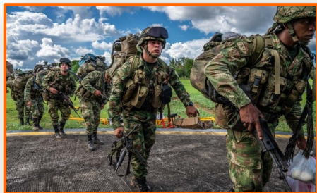
Dos militares muertos y 11 heridos tras ataque guerrillero en Colombia en frontera con Venezuela

“Tenemos información de que niños de la comunidad Motilón-Barí que hacen presencia en ambos países están más expuestos a ser víctimas de reclutamiento”, expresó el funcionario departamental. Además la migración de población venezolana es uno de los escenarios que ha sido utilizado por diversos grupos al margen de la ley, para continuar aumentando este fenómeno.