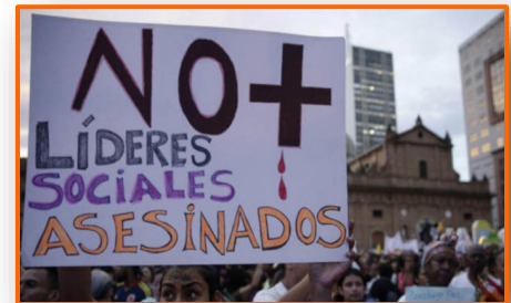
Asesinan a otro líder social en Colombia: suman 26 durante 2021