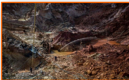
Niños de Amazonas y Bolívar abandonan las escuelas para trabajar en minas