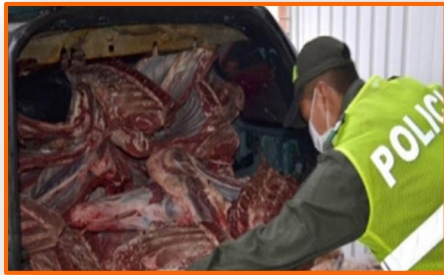
Cúcuta afectado por reactivación del contrabando de carne de res proveniente de Venezuela

Esta medida busca proteger a la población migrante que se encuentra actualmente en condiciones de irregularidad, teniendo en cuenta que se trata de la población más vulnerable, medida que adicionalmente desestimula la migración irregular con posterioridad a la entrada en vigencia de la norma.