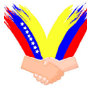
Frontera Colombia: Acnur y Corprodinco abren La Casa que Abraza

La población migrante, retornada, refugiada, desplazada, especialmente de la comunidad LGBTI + plus, pueden acudir al Centro de Referencia La Casa que Abraza, un lugar donde recibirán orientación jurídica para acceso a derechos, ayuda psicosocial y prevención en salud. Esta iniciativa, de respuesta diferenciada a la comunidad vulnerable, ha sido un logro materializado gracias al apoyo de Acnur, la Agencia de la ONU para los refugiados en conjunto con su aliado estratégico Corprodinco. Con la apertura de este espacio, ya son tres las casas de acogida que entre 2020 y en lo corrido de febrero de 2021 han atendido a más de 900 personas.