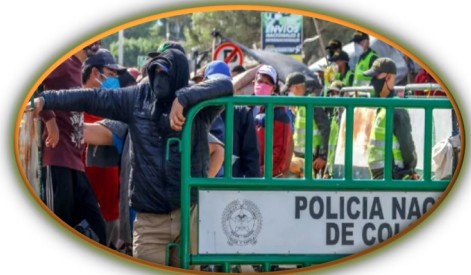
Alerta en Cúcuta por masivo paso de venezolanos a Colombia que buscan regularización

En reciente operación del Ejército colombiano, en El Carmen, fueron recuperados cinco menores de edad, mientras que un adulto fue sometido a la justicia, tras ser sorprendidos con un fusil R15 Bush Máster, una pistola Prieto Beretta, proveedores y munición de diferentes calibres, que dejaron entrever el desolador panorama que siguen afrontando los niños y adolescentes que son reclutados por los grupos armados ilegales en la región. Según el Ejército, estos menores, al parecer, habían sido reclutados de manera forzada por la disidencia del frente 33° de las Farc que delinque de manera exponencial en Norte de Santander.