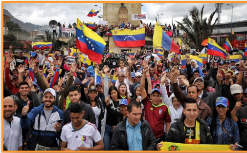
ESPECIAL | Venezolanos en Colombia: la gran apuesta humanitaria

Ninguna de las decisiones que ha tomado el presidente Iván Duque durante su gobierno habían tenido un respaldo tan certero, y desde sectores tan disímiles, como la de regularizar masivamente a los cerca de dos millones de migrantes radicados en el país. Pocas veces un tema en la política logra unir voces tan distintas y tan importantes. “Agradezco al presidente Duque y al pueblo de Colombia. Esta decisión salvará vidas y creará un futuro más sólido para toda la región”, escribió Bill Clinton. “Histórico” añadió The New York Times. En el país, la decisión fue elogiada tanto por Álvaro Uribe como por el líder de la oposición al gobierno, Gustavo Petro. Embajadores, empresarios, políticos y organismos internacionales se unieron a este agradecimiento, que también fue recibido de pie por asociaciones de migrantes en Colombia. "En medio de la mayor catástrofe humanitaria del hemisferio occidental (...) nuestra Federación ve como un gesto histórico esta acción solidaria", reza un comunicado de prensa emitido por la Coalición por Venezuela, que agrupa a más de 30 organizaciones de migrantes en el país.