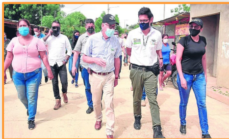
Optimismo e inversión, la esperanza de los Alcaldes de frontera con la regularización de migrantes

Ninguna de las decisiones que ha tomado el presidente Iván Duque durante su gobierno habían tenido un respaldo tan certero, y desde sectores tan disímiles, como la de regularizar masivamente a los cerca de dos millones de migrantes radicados en el país. Pocas veces un tema en la política logra unir voces tan distintas y tan importantes. “Agradezco al presidente Duque y al pueblo de Colombia. Esta decisión salvará vidas y creará un futuro más sólido para toda la región”, escribió Bill Clinton. “Histórico” añadió The New York Times. En el país, la decisión fue elogiada tanto por Álvaro Uribe como por el líder de la oposición al gobierno, Gustavo Petro. Embajadores, empresarios, políticos y organismos internacionales se unieron a este agradecimiento, que también fue recibido de pie por asociaciones de migrantes en Colombia. "En medio de la mayor catástrofe humanitaria del hemisferio occidental (...) nuestra Federación ve como un gesto histórico esta acción solidaria", reza un comunicado de prensa emitido por la Coalición por Venezuela, que agrupa a más de 30 organizaciones de migrantes en el país.