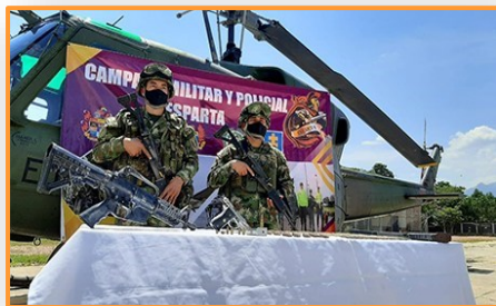
Rescatados menores de edad reclutados por la guerrilla en Norte de Santander

A inicios de junio de 2019 estos grupos armados irregulares dieron un ultimátum a productores agropecuarios de los municipios José María Semprún y Catatumbo, del sur del Lago de Maracaibo en el estado Zulia, y ya a mediados de ese mes habían logrado expulsar a 15 de ellos de sus unidades de producción, según reflejaron en su momento medios locales.