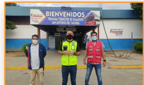
Se activa el transporte suburbano hacia la frontera