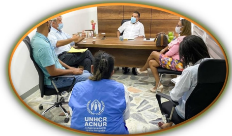
Frontera: ACNUR reafirma apoyo al Gobierno Departamental para garantizar la cooperación internacional