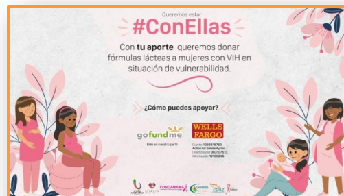
Cepaz, Funcamama, Unión Afirmativa, Prepara Familia, Uniandes y Acción Solidaria: Alianza #ConEllas lanza nueva campaña para ayudar mujeres embarazadas con VIH/sida