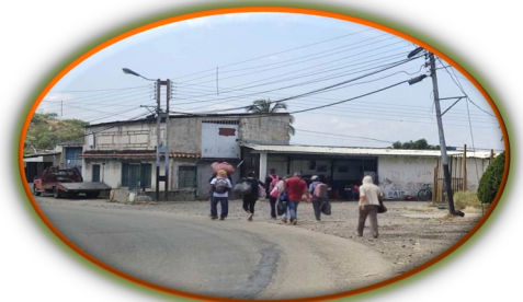
No se detiene el peregrinaje hacia la frontera