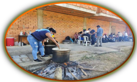
Frontera: Olla solidaria para los caminantes y retornados