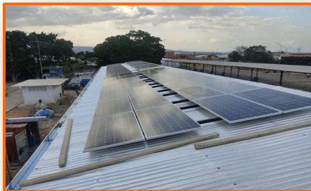
Instalan sistema fotovoltaico y lámparas con iluminación LED en el Terminal de San Antonio