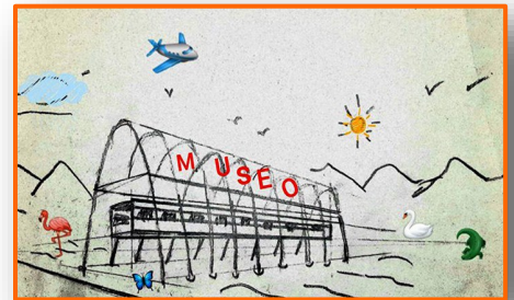
La migración tiene museo virtual