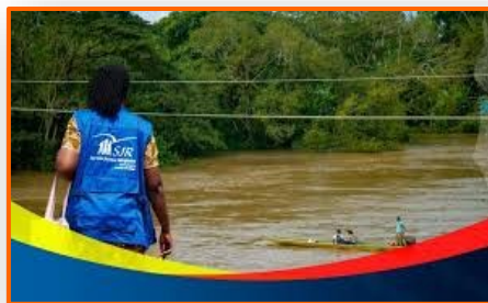
Servicio Jesuita rechaza medidas implementadas para impedir el tránsito de migrantes en la frontera entre Arauca y Apure