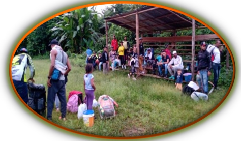
Colombia capturó a coyotes venezolanos en la frontera

Migración Colombia capturó a 198 traficantes de personas en la frontera con Arauca. Según las investigaciones cobraban hasta 1600 dólares para pasar a venezolanos por las trochas. El director de Migración Colombia, Juan Francisco Espinosa, señaló que han sido capturado 198 traficantes de migrantes, “o coyotes”, como se les conoce informalmente y la desarticulación de 60 redes de migrantes. La entidad rechazó esta práctica y recordó que siguen luchando en la defensa de los derechos humanos. Por otra parte, Migración aseguró que, ante el aumento de transporte ilegal para migrantes, le iniciaron actuaciones administrativas en contra de cuatro empresas que transportaban de manera ilegal a los venezolanos.