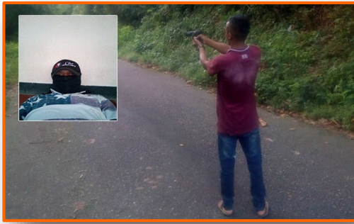
A alias Nula, nuevo comandante del ELN, presunto ex GNB de Apure, atribuyen homicidios recientes en las trochas

La autoría de los más recientes crímenes ocurridos en las trochas binacionales, además de otros, sería de alias Nula, un presunto ex-GNB, nativo del estado Apure, quien ha creado todo un imperio de terror entre Táchira y Villa del Rosario, amparado en la guerrilla, específicamente el ELN. Para noviembre de 2020, le adjudicaron al menos cinco homicidios, secuestros y desapariciones.