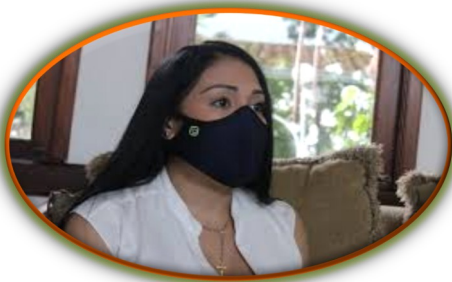
Gómez: crisis económica del Táchira podría combatirse con una Ley de Frontera

Se estima que, en 2021, 162.000 caminantes pasarán por Colombia, 90.300 por el Ecuador, 75.600 por el Perú y 2.900 por América Central y México (R4V 10/12/2020). La estimación real del número de caminantes es sumamente difícil, ya que la cifra puede variar drásticamente en función a la situación en Venezuela o el acceso al transporte.