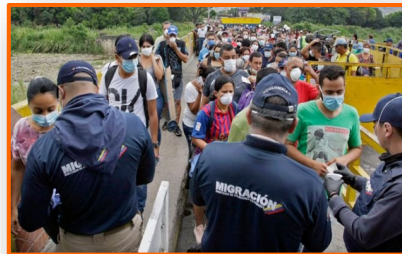
Hechos 2020 | Los cambios de frontera en este año