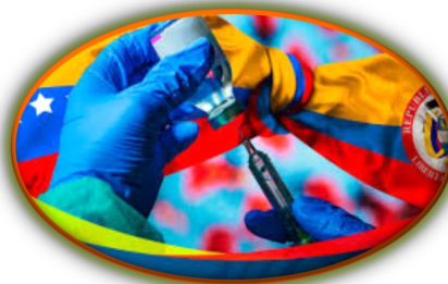
Plan de vacunación colombiano prevé aplicar más de 340 mil dosis en una primera fase en la frontera con Venezuela

Un usuario que se traslade de la frontera de Paraguachón, en el municipio Guajira, hasta la ciudad de Maracaibo necesita 300 mil pesos colombianos. Pero este no es el único problema que les toca solventar para poder movilizarse. Varios de estos pasajeros manifestaron que en los puntos de control ubicados en la carretera Troncal del Caribe les exigen las pruebas PCR para descartar casos de COVID-19, si no portan dicha prueba deben bajarse de la mula con hasta 20 dólares en cada alcabala. Durante este mes de diciembre han aumentado las denuncias de los usuarios contra los funcionarios militares y policiales que trabajan en los diferentes puntos de control. A principios del mes se creó una mesa de trabajo entre el sector transporte y cuerpos de seguridad pero hasta la fecha no ha habido resultados positivos.