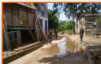
Incrementan patrullaje a pie en Norte de Santander

Un usuario que se traslade de la frontera de Paraguachón, en el municipio Guajira, hasta la ciudad de Maracaibo necesita 300 mil pesos colombianos. Pero este no es el único problema que les toca solventar para poder movilizarse. Varios de estos pasajeros manifestaron que en los puntos de control ubicados en la carretera Troncal del Caribe les exigen las pruebas PCR para descartar casos de COVID-19, si no portan dicha prueba deben bajarse de la mula con hasta 20 dólares en cada alcabala. Durante este mes de diciembre han aumentado las denuncias de los usuarios contra los funcionarios militares y policiales que trabajan en los diferentes puntos de control. A principios del mes se creó una mesa de trabajo entre el sector transporte y cuerpos de seguridad pero hasta la fecha no ha habido resultados positivos.