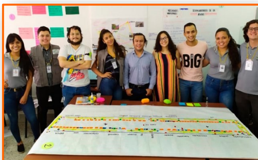
Desarrollan investigación sobre aproximaciones en la frontera

El Fondo de Población de las Naciones Unidas UNFPA en Venezuela apoyó esta jornada junto con ACNUR Venezuela, UNIANDESac, y otras organizaciones sociales, junto con las instituciones públicas, autoridades locales y liderada por Protección Civil, para la población de Zorca que fue afectada por estas inundaciones y lluvias. En situaciones de emergencia tiende a aumentar la violencia, especialmente la violencia sexual, hacia las mujeres adolescentes y niñas, también puede interrumpirse o empeorar la situación de las personas para acceder a artículos esenciales, a medios de vida que les permitan superar las dificultades y no poner en riesgo su salud y hasta sus vidas.