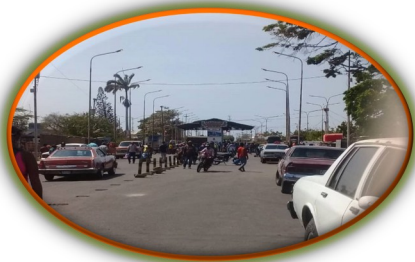
Frontera: En Guajira denuncian más abusos en los puntos de control

En el transcurso de 2020 FundaRedes ha documentado la presencia de más de 9 grupos armados irregulares, quienes ya ejercen el control del territorio en más de 20 entidades de Venezuela, siendo los más destacados y de mayor poder el ELN y las FARC.