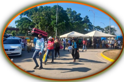
165 mil personas se movilizaron por la frontera colombo-venezolana durante diciembre