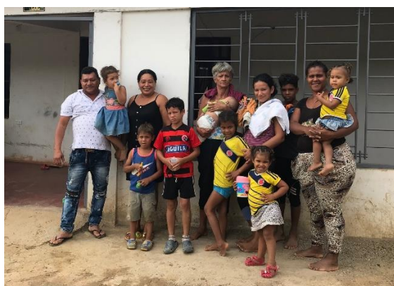
Venezolanos recién llegados a Las Delicias.

Ante el contexto actual de COVID-19, la generación de ingresos y los medios de vida de la población venezolana se han visto gravemente afectados . La mayoría de las personas refugiadas y migrantes se encuentran en situación de irregularidad, por lo que sus sustentos diarios provienen del ejercicio de actividades informales como las ventas ambulantes. Dada las medidas de aislamiento preventivo obligatorio tomadas por el Gobierno Nacional desde el mes de marzo, muchas familias se han visto expuestas ante la necesidad de retornar a su país en condiciones no favorables, ante el riesgo de permanecer en situación de calle y no poder cubrir sus gastos básicos para permanecer en Colombia.