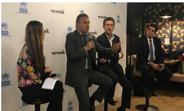
Representantes del ACNUR, WeWork, el gobierno nacional y organizaciones de venezolanos, discutiendo sobre los retos en el acceso al mercado laboral.