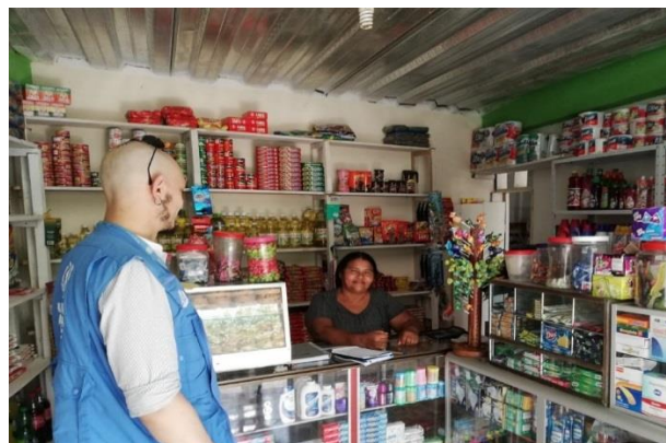
Personal de ACNUR visita unidades de generación de ingresos e iniciativas de emprendimiento en Villa Rosas, Mocoa (Putumayo)

Refugiados y migrantes han sido acompañados en el marco del GIFMM para acceder a oportunidades de empleo y autoempleo ante la contingencia COVID-19.