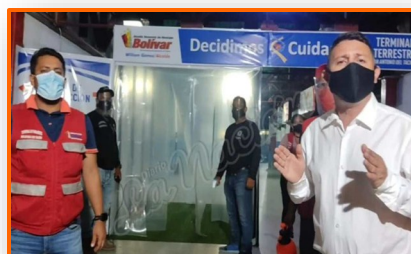
Frontera: Terminal de Pasajeros de San Antonio del Táchira inicia sus operaciones

Las autoridades colombianas y venezolanas deben establecer de manera urgente canales de comunicación para resolver incidentes violentos a lo largo de la frontera, posiblemente con respaldo internacional. Deberían reabrir los cruces fronterizos formales según lo planeado, pero también aumentar la ayuda humanitaria para ayudar a garantizar que los migrantes y refugiados estén sanos y puedan moverse con seguridad.