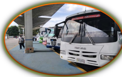
Rutas largas sin permisos afectan a transportistas de la frontera