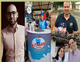
Historia de migrantes

Son los rostros de la superación. Estos migrantes venezolanos con disciplina y constancia se han convertido en ejemplo del emprendimiento en el país. Dejaron de ser empleados para ser dueños de su propio negocio, con el que apoyan también a los colombianos a tener un trabajo digno.