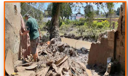
Fenómeno "La Niña" duplicó lluvias en la frontera y zona Sur del Táchira