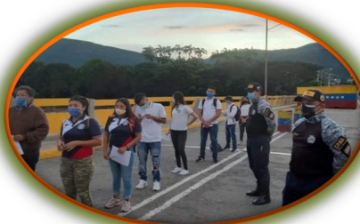
Estudiantes venezolanos cruzaron la frontera para el preuniversitario