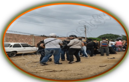
Largas filas para cruzar la frontera por paso ilegal