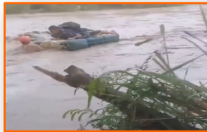
Video | Así desafían algunos al río Táchira crecido para cruzar la frontera

Las lluvias registradas en la región hacen crecer el caudal del río Táchira, límite fronterizo de Venezuela con Colombia por San Antonio, sin embargo la fuerte corriente y alto nivel del agua no impide a algunos cruzar a Colombia. La corriente es desafiada por quienes acuden a los pasos ilegales cuando el afluente está crecido. Personas que se encuentran en las trochas se encargan de trasladar en balsas construidas con pimpinas a quienes desean cruzar.