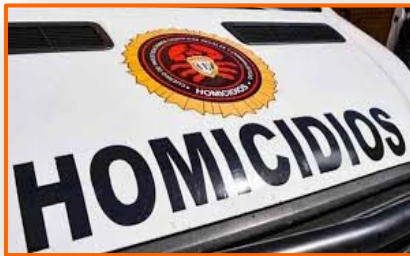
Secuestraron a hombre en Mara (Zulia) y entregaron a guerrilla para que lo mataran

“Desde 2015 que se cerró la frontera, está claro que todo vehículo que ingrese es de contrabando, pero empezamos a ver que llegaban carros de menor costo, pero hoy en día estamos plagados de camionetas de alta gama venezolanas, carros convertibles y otros de las marcas más lujosas del mercado que abiertamente son de contrabando y las autoridades lo saben”.