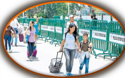
Gobierno Colombiano implementará el PRASS en zonas fronterizas