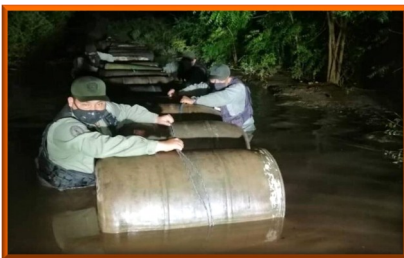
Pretendían pasar 11 mil litros de gasolina colombiana por los embalses del Zulia