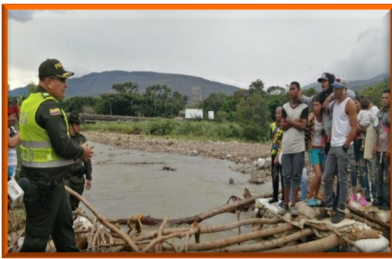
Habilitan punto de paso para los caminantes en la frontera