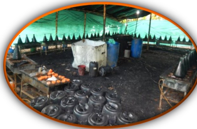
Ejército colombiano destruye complejo cocalero de las FARC en pueblo fronterizo con Venezuela