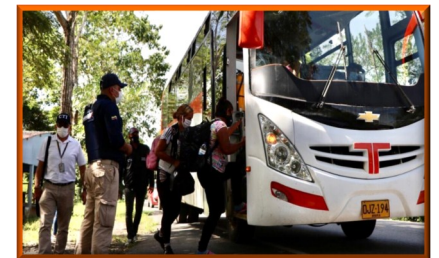
Se refuerza vigilancia en trochas y vías del departamento de Arauca ante masiva llegada de caminantes venezolanos