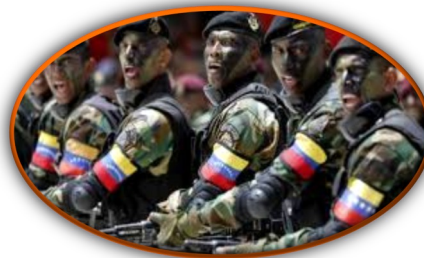
Maduro insiste que Duque prepara "mercenarios" para "agredir" los puestos militares fronterizos.