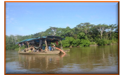
Denuncian paso de embarcaciones cargadas de combustible hacia las minas ilegales del municipio Autana en Amazonas