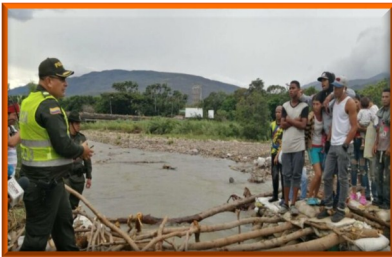
La crisis venezolana pone al borde del colapso la frontera con Colombia

La operación forma parte del plan “Frontera Segura y Regulada” de las autoridades del departamento Norte de Santander. Todo para evitar la migración ilegal y los delitos en esos pasos.