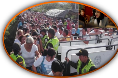
Canciller Claudia Blum: Ley de Fronteras “reactivará a Norte de Santander”