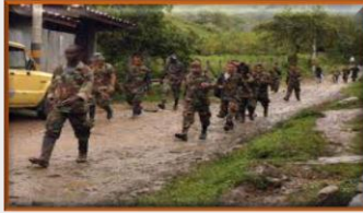
Frontera: Migrantes venezolanos también ponen cuota de muertos en masacres en Colombia