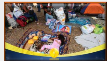
Venezolanos retornados denuncian condiciones inhumanas en albergues en las fronteras