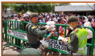
Embudo migratorio podría llegar a 20 mil extranjeros en la frontera colombo-venezolana