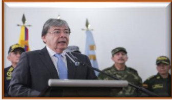
Frontera: Disidentes de las Farc asesinaron a cuatro militares durante una operación antidrogas en Colombia