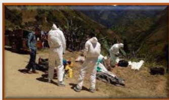
Nueva masacre: asesinan a 3 jóvenes en Norte de Santander fronterizo con Venezuela