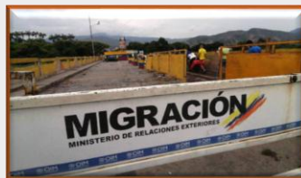
Autoridades buscan diálogo con Venezuela para el retorno de migrantes