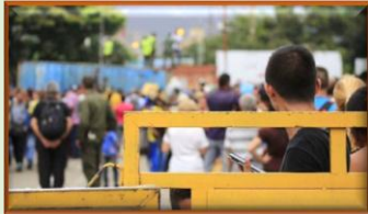
Comunidades religiosas atienden a migrantes represados en la frontera