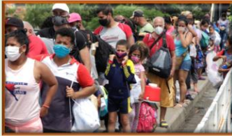
Ayuda del papa llega a migrantes varados en la frontera entre Colombia y Venezuela