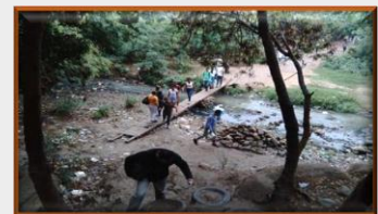
Frontera: “Pagué 100 mil pesos para volver a Cúcuta”