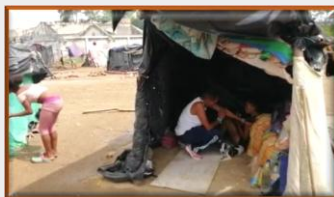
Crisis en frontera genera desocupación de viviendas en el municipio de Villa del Rosario.