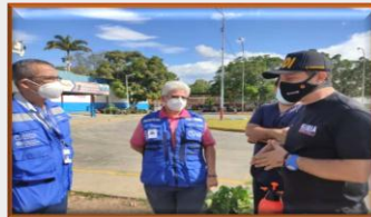
Comisiones de las Naciones Unidas y OPS visitaron la frontera con Colombia