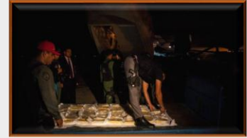
Venezuela impulsa la minería de oro en áreas protegidas del Amazonas