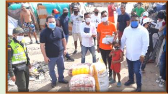
Empieza a reactivarse comedor para migrantes en Cúcuta