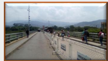
Colombia: Frontera permanecerá cerrada hasta el 1 de octubre