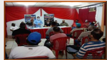
Instalan mesa de trabajo para reactivar el transporte en la frontera