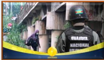
La frontera cerrada es un territorio abierto a la corrupción