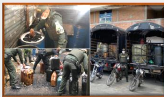
Colombia propinó duro golpe al contrabando de gasolina y productos cárnicos venezolanos