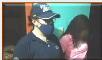
Rescatan en Colombia a menor venezolana víctima de explotación sexual, gracias a la aplicación móvil LibertApp, del ente migratorio.