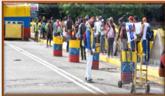
¿Y el nuevo gerente de frontera? Por: Ronal F. Rodríguez