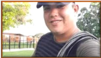
Homicidio y narcotráfico: el historial del más buscado en el Sur del Lago, muerto a manos del ELN en Zulia