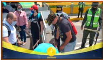
Secretarías de Fronteras y Educación de Norte De Santander gestionan entrega de 720 cartillas a estudiantes en Venezuela