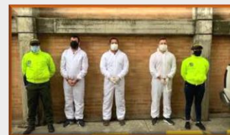
Capturan 4 venezolanos, enviados presuntamente por Nicolás Maduro a Colombia