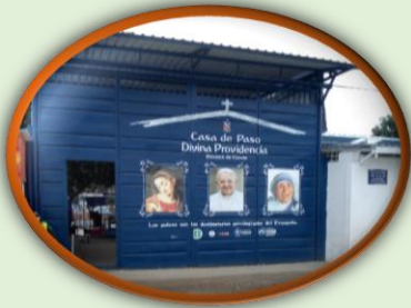
Articulan esfuerzos para atender a la población venezolana en Cúcuta