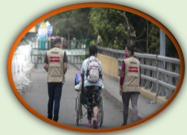
Estoy en la Frontera y Acnur se unen para mostrar las historias de integración en la región. Trabajando juntos desde una redacción