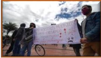
Cifran en 50 las masacres ocurridas en Colombia en lo que va de año