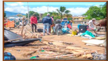
Autoridades colombianas desocuparon La Parada de migrantes venezolanos que aguardan por retornar a su país