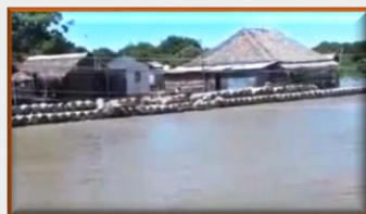
Ahora el contrabando de gasolina es de Colombia hacia Venezuela (Video)