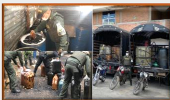
El conflicto golpea Cúcuta, mientras su Alcalde no sabe qué hacer con la seguridad