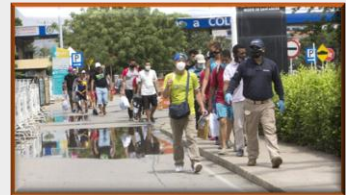
Diseñan plan para monitorear retorno de migrantes en la frontera