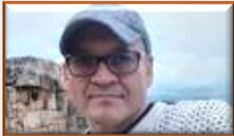
Buscan en la frontera con Venezuela a docente Secuestrado en Maicao