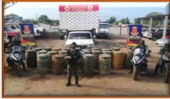
Confiscan 6.600 litros de gasolina colombiana en Mara