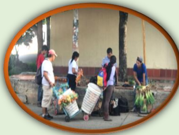
UE invertirá recursos para inmigrantes en Cúcuta, Villa del Rosario y Pamplona