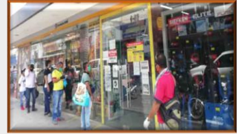
Con medidas especiales vuelve "la normalidad" a Cúcuta