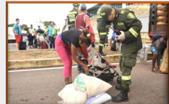
Colombia: Cerco para resolver el ‘embudo migratorio’ en la frontera