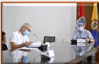
Norte de Santander declara alerta roja por aumento en casos de Covid