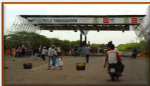
Denuncian genocidio, abuso y hambruna en la Guajira venezolana

Seboruco, capital del municipio Seboruco del Táchira, está en el corazón del estado. Su población está estimada en no más de 15 mil habitantes y siempre se caracterizó por la agricultura y las artes, especialmente la música. Hoy está infectada de guerrilleros. No es inocente el video de alias Edward, del ELN, jurándole lealtad a Nicolás Maduro. En total habría poco más de 170 guerrilleros regados por el pueblo. Las autoridades civiles y la Fuerza Armada Nacional Bolivariana prefieren no darse por enterados, aun cuando el tema es vox populi en todo el municipio Seboruco. “Yo fui a una reunión que convocó la guerrilla en mi comunidad el sábado 18 de julio”, dice a Infobae un habitante de la aldea Las Flores, sector La Paujilera. “Nos reunieron dentro de la escuela municipal. Leyeron la cartilla, dijeron cuáles eran sus condiciones y nosotros no pudimos decir nada, porque el Gobierno está detrás de ellos. ¿Qué va a poder uno protestar algo? Ellos ahora son la autoridad”.