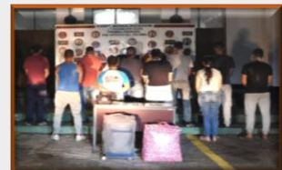
Desmantelada en San Antonio banda dedicada al tráfico de connacionales