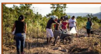
FANB informa la captura de más de un millar de trocheros