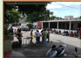
Frontera: La "olla solidaria" alcanza para todos