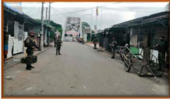
Colombia: Anuncian arribo de refuerzos para zona rural y la frontera