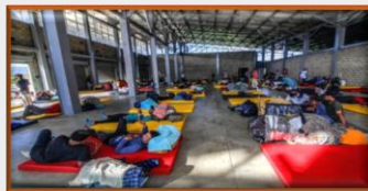
Venezolanos aislados por el covid-19 en la frontera denuncian que son víctimas de robos, prostitución y hambre