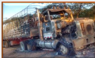
Queman en Paraguachón gandola que llevaba mercancía a Maracaibo