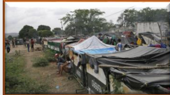
Las cuatro fases de espera en la frontera para retornar a Venezuela