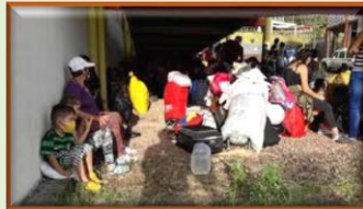
Alimentos a migrantes que retornan y personas con necesidad brindan 40 Caritas parroquiales fronterizas