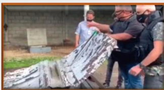
Presos dueños y empleados de una distribuidora de combustible en Táchira