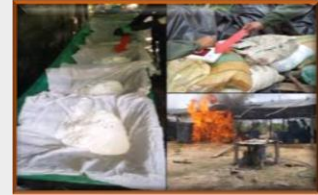
Incautan 9.100 kilos de cocaína y destruyen 25 'narc laboratorios' en Sur del Lago