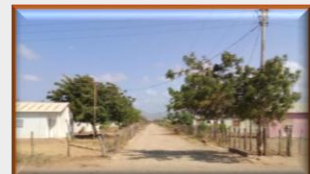
Rancherías del municipio Guajira-Zulia se encuentran preocupados por las acciones en las trochas