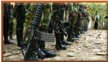
Paramilitares asesinan a una mujer e hirieron a un hombre en finca fronteriza del Táchira