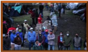
Restricciones de Venezuela retrasarán retorno de ciudadanos hasta 6 meses

Con esta afirmación los pobladores de la Guajira zuliana recorren kilómetros para poder llegar al lugar donde las organizaciones de ayuda humanitaria internacional realizan la entrega de comida a la población que emigra de forma viceversa. En medio de esta pandemia por la COVID-19, los vecinos cercanos a la línea fronteriza de Paraguachón se ven en la necesidad de buscar ayuda en el departamento de la Guajira colombiana; la llegada de la pandemia complicó el día a día de los habitantes de esta región zuliana. Algunos pobladores señalaron que mensualmente la Cruz Roja colombiana hace entrega de alimentos a las familias venezolanas más vulnerables en esta línea fronteriza. Acotaron “aquí no hay trabajo ni efectivo y nos vamos para el otro lado cada vez que escuchamos que entregan ese beneficio”. Muchos cruzan las trochas con el temor de contagiarse, pero la necesidad y el hambre los obliga a correr el riesgo de romper las medidas preventivas.