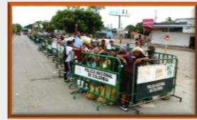
Migración Colombia advierte sobre traslados ilegales de venezolanos