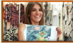
Frontera: Tapabocas por los refugiados en Colombia