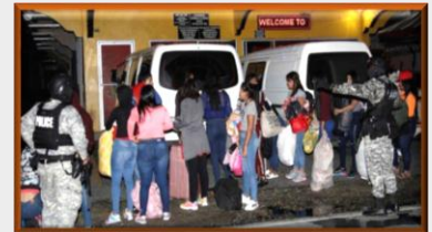
4.000 mujeres venezolanas traficadas en Trinidad y Tobago en los últimos 4 años