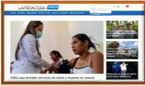
Estoy en la Frontera llega a La Guajira y Arauca