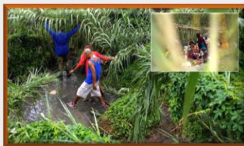
Falta de información sobre retornados en la frontera angustia a familiares y alerta a ONGs