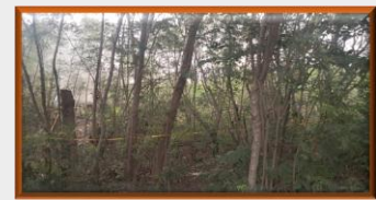
En la frontera, Ejército colombiano enfrentó a grupo de hombres armados que delinque en territorio venezolano.