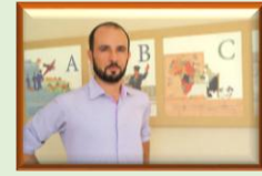
Juntos Aparte, Encuentro Internacional de Arte, Pensamiento y Fronteras'. "La frontera es un espacio de pensamiento"