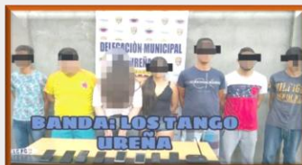
Detiene el Cicpc en Ureña a "actores porno" mientras filmaban y rescatan a menores de edad, algunas de ellas estaban retenidas contra su voluntad.