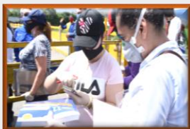
Entregaron 350 nuevas cartillas pedagógicas a estudiantes en la frontera