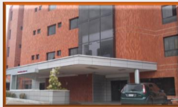
Táchira: Medicina privada al mínimo, ante ausencia de pacientes colombianos