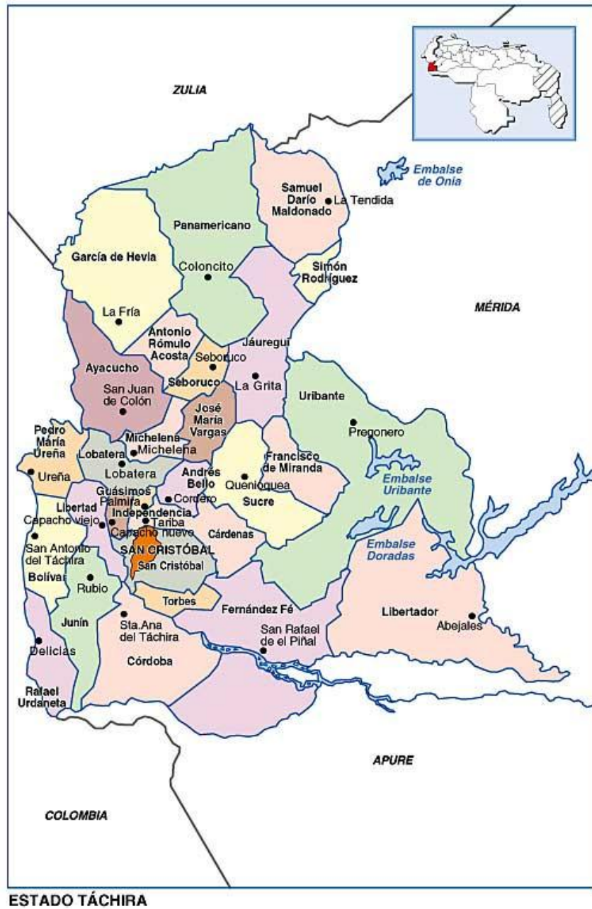
Imagen 1: Mapa político-territorial del Estado Táchira